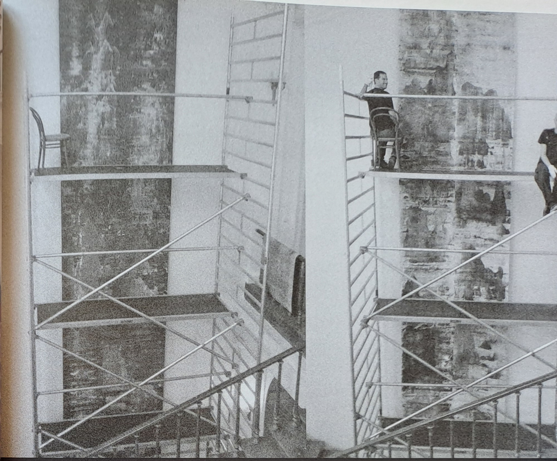
Vize horské krajiny, 2014 akryl, olej, plátno, 750 x 180 cm