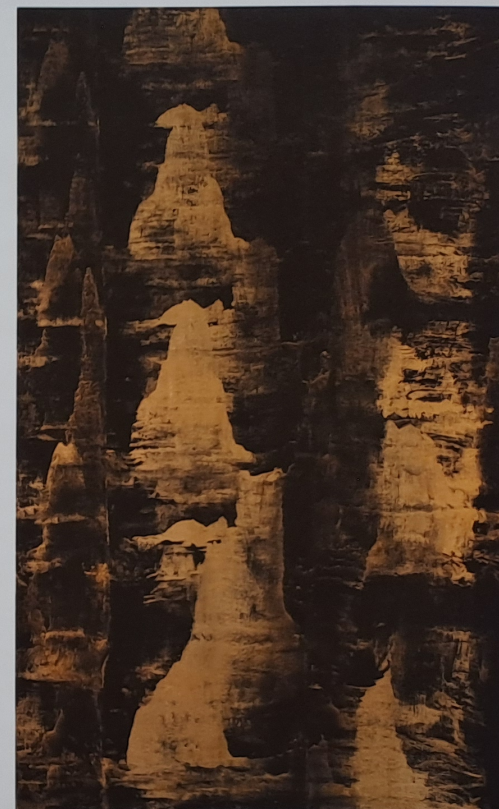
Japonské hory, 2013, akryl, olej, plátno, 130 × 80 cm

Prvním zlomem pro mě bylo určité setkání se severskou krajinou a její syrovostí – Norsko, Švédsko, Dánsko. Moře mě hodně ovlivnilo. Poté to byla ruská kultura, za pobytu v Petrohradu. Nejdříve to byly Postavy u břehu moře nebo Bílé moře, Sle-