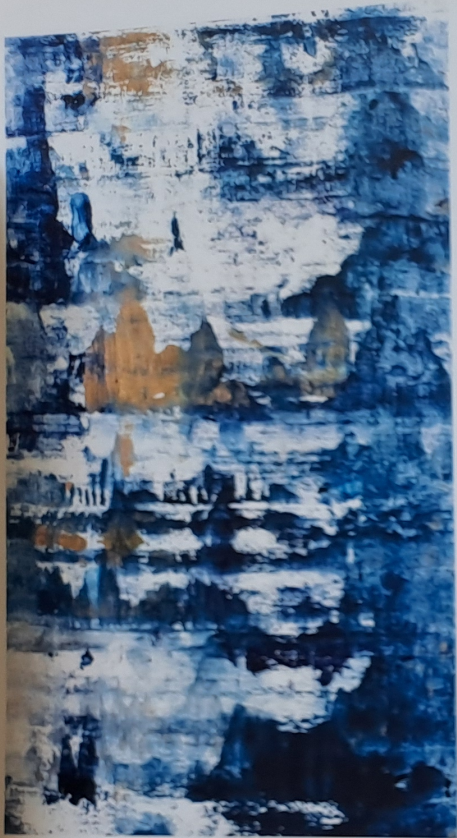
Modré kopce, 2014, olej, plátno, 120 × 75 cm

Znamenáváš v zahraničí poněkud jiný vkus a tedy i reakce na tvé práce?