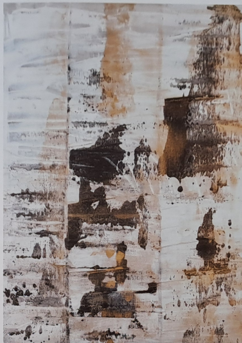
Bílé pole, 2013, akryl, olej, plátno, 130 × 90 cm

Když jsme spolu hovořili v roce 2008, maloval jsi Sakrální krajiny a definitivně vymizela figura z tvé ikonografie. Cítíš se tedy být krajinářem (duše)? (stavů, atmosféry, podobnoství, rozpoložení atd.)