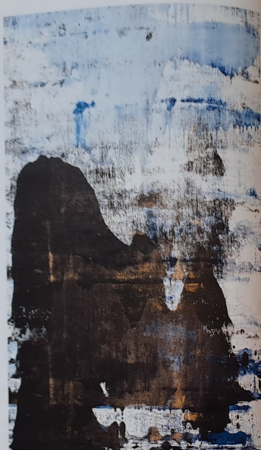
Čínský útes, 2014, akryl, olej, plátno, 120 × 75 cm

Itálie je úžasné místo, vyvolávalo to ve mně vzpomínky na minulé cesty do Sieny, Florencie, Raveny, Benátek a Verony. Cítíte moře