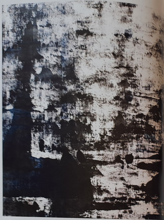
Modrá hora, 2014, akryl, olej, plátno, 120 × 78 cm