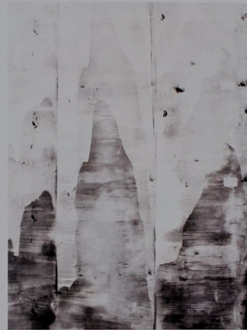
Čínská krajina (Tři hory), 2013. akryl, plátno, 130 × 95 cm

Ve většině věcí starších i novějších vedu vnitřní dialog, vždy teď je to více zřejší díky technice, kterou používám, více asociuje čínskou tušovou malbu. Některé reakce přišly při mé intervenci u Salvátora, kde jeden obraz hodně připomínal starý svitek, bylo to shodou okolností na oltářním obraze, který jsem