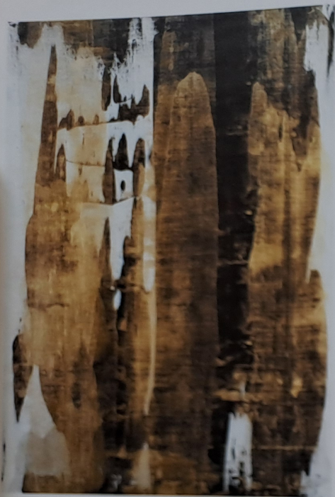
Zlaté hory, 2013. akryl, olej, plátno, 120 × 80 cm