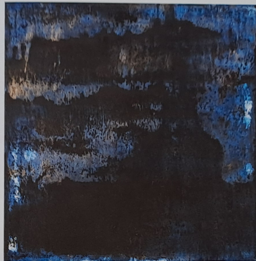
Čínské kopce, 2014, olej, plátno, 40 × 40 cm

Asi všechno dohromady. V čase přicházejí stále nové impulzy a výzvy, na které reaguji pokaždé jiným způsobem a současnými malířskými prostředky. Vždy mě bavilo hodně experimentovat a v malbě jsem se nechtěl nikdy opakovat. Nejhorší je pro umělce jistota dosaženého cíle, kdy začne svou práci opakovat a rozměňovat. Vzniká rutina a začne to sázet jako vejce k vejci, zůstane stát na jenom místě. Barva a plátno je velmi živá ma- terie. Malba je fascinující a dobrodružná cesta, umělec nebez- pečně proniká někam do hlubin světa a vlastní psychiky a sna- ží se proniknout až ke hmotě. Je to expedice někam do útrob Země. Před pár dny jsem dělal obří instalaci v Liberci, jednalo se o performanci ve spolupráci se Saskou akademií a Katedrou