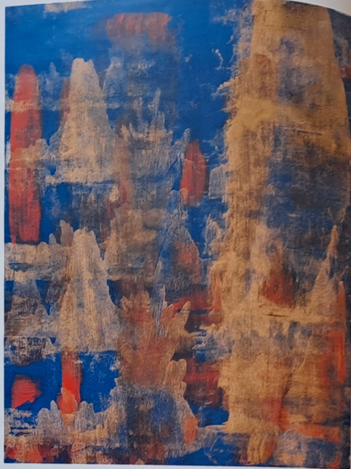
Hořící hory, 2013, akryl, olej, plátno, 90 × 70 cm

Zajímalo mě, zda může obraz vyvolávat emoce a proto jsem si to chtěl vyzkoušet na místě ve galerijním čistém prostoru centra současného umění Dox. Ten v současné době nejvíce naplňuje