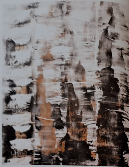
Krajina v pohybu, 2013. akryl, olej, plátno, 130 × 115 cm

zakryl a kde byl vypořádán František Xaverský, jeden z největších misionářů, který působil na dálném východě a v Číně, kde také zemřel. Takže paralela zde také byla. Některé archetypy jako myšlení, cit, vnímání i osobní nevědomí jsou základní pilíře analytické psychologie. Jung vstoupil hluboko do pochopení lidské psychiky až do světa snů, umění, náboženství, filosofie a mytologie. Přitom to byl syn protestantského faráře, prožíval otcovy pochybnosti spojené s vírou a sám se často oddával osobní imaginaci a pokoušel se navázat kontakt s bohem. Jeho apokalyptické sny a zážitky z dětské imaginace jsou pro nás všechny důležité právě kvůli všem těm vrstvám lidské duše.