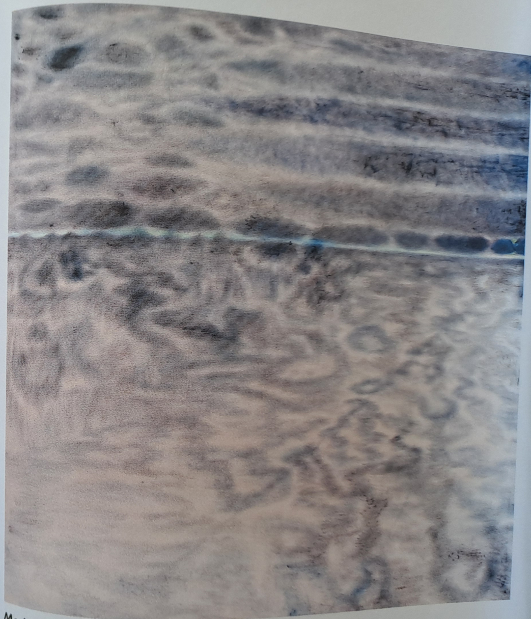
Modrá krajina (diptych), 2006, olej, plátno, 150 x 300 cm