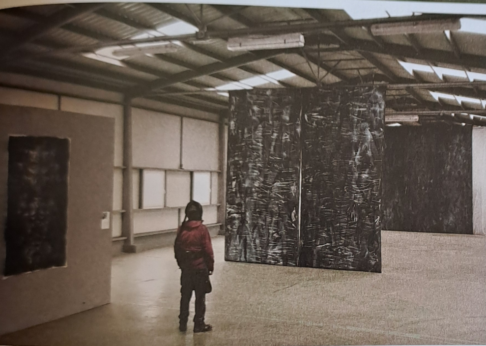
Patrik Hábl: Místo a figura , Galerie Bubec, 2018