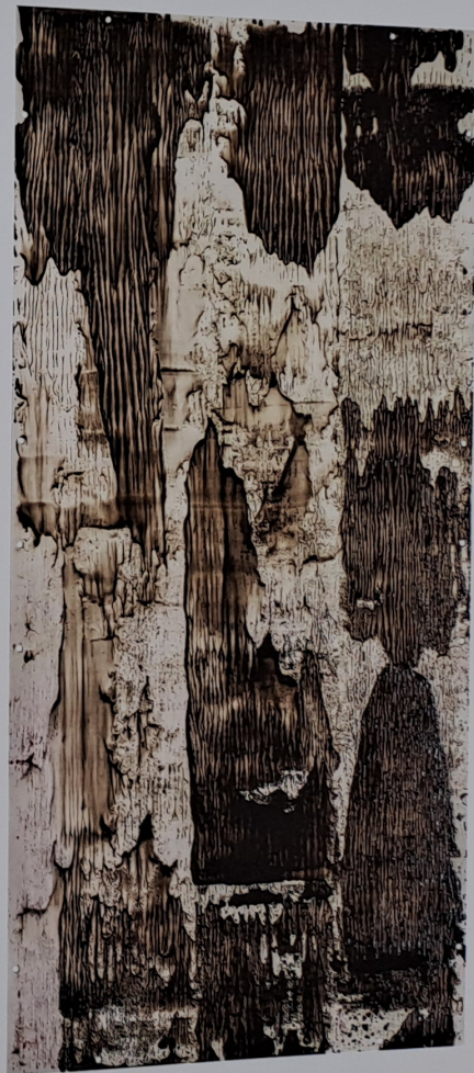
Japonská krajina / Japanese Landscape 255 × 125 cm