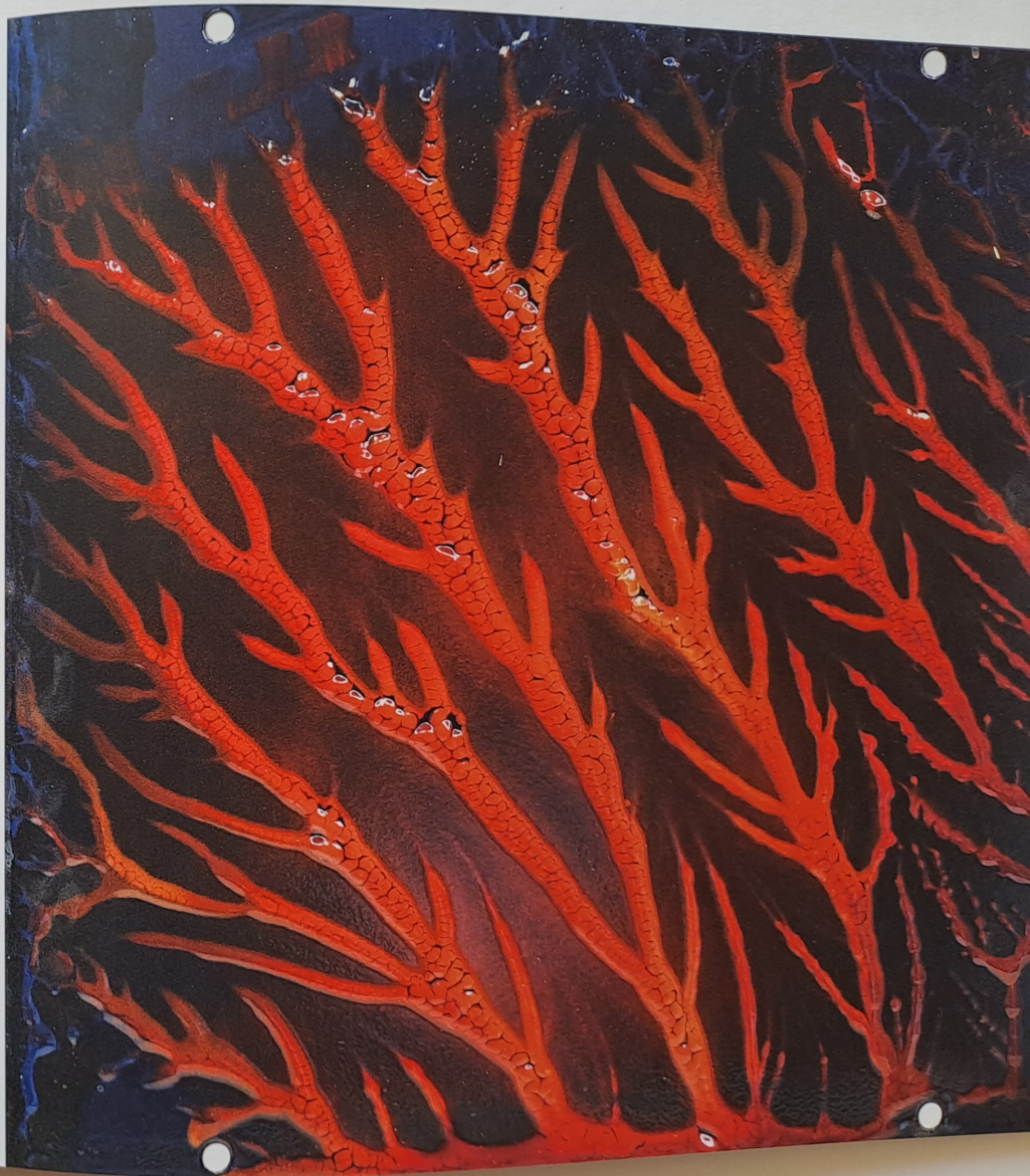
→ Hořící keř / Burning Bush 62,5 x 62,5 cm