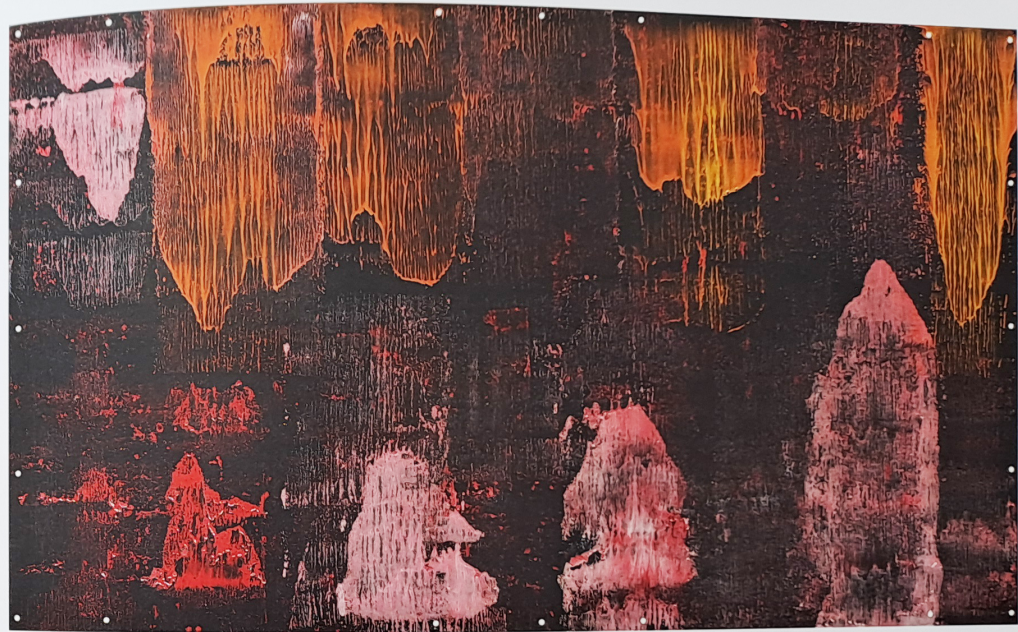
Čínská krajina / Chinese Landscape 148 x 255 cm