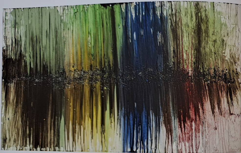
Rozpuštěná krajina / Dissolved Landscape 148 × 255 cm