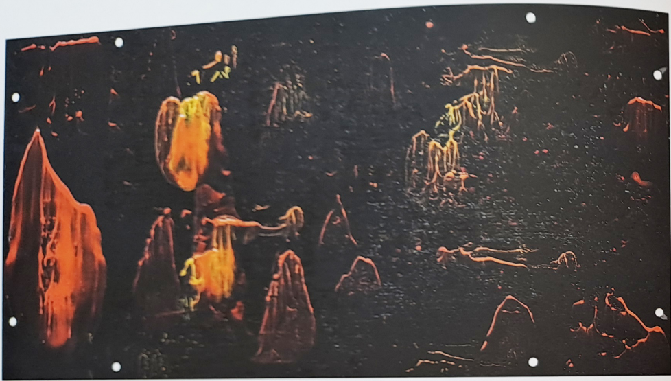
Sopečná krajina / Volcanic Landscape 62,5 x 125 cm