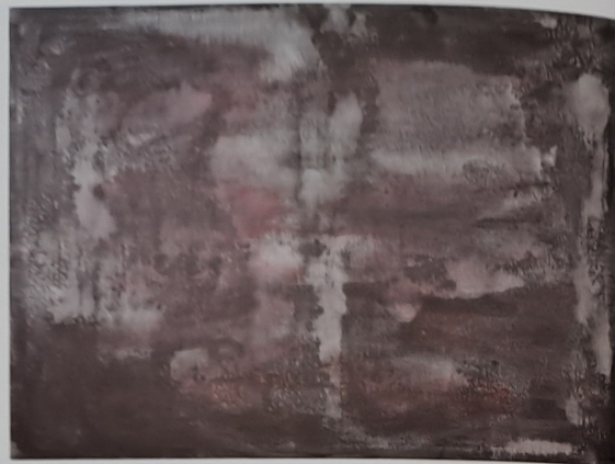
Kruchy vosk, 2008, akryl, plátno, 105 x 142 cm

Je to určitá pozoruhodná cesta, na jejímž konci je poznání sebe sama. Pohybový záznam, deník, který se skládá z různých důležitých, ale i banálních situací, deník, ve kterém sice nemůžeme listovat, ale vnímáme ho jako přerývaný děj. Je to letmý dotyk stopy energetických polí.