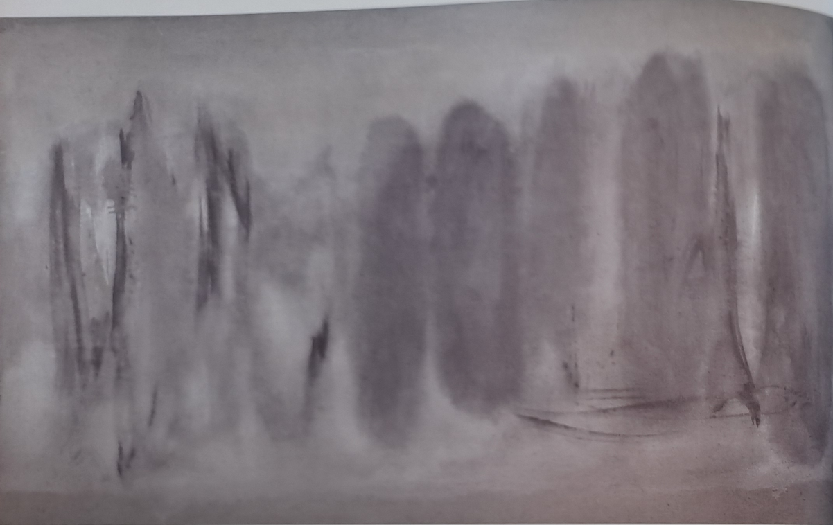
Imaginativní les, 2007, akryl, plátno, 100 x 171 cm

hledání „ztraceného ráje“, putování k horizontu... za něj a dále... vzpomínáš si ještě na „chuť“ těch let?