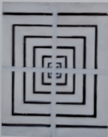
Rastr III, 1997, olej, plátno, 62 x 52 cm

Asi podvědomě hledám nějaké to Satory. Stav o kterém mluví Jack Kerouac, jako o stavu náhlého osvícení či náhlého probuzení nebo prostě jen kopnutí mezi oči. Každá má cesta, každý můj příběh je jedno velké Satory. Ale asi je to o procesu, o samotném malování, které je to největší transcendentno, jaké si vůbec dovedeme představit. Je to asi něco, co překračuje smyslovou zkušenost v náboženském smyslu, něco, co přesahuje člověka směrem k tomu, co stojí nad ním, k nadmyslnu, božskému principu. Nadmyslnu, transcendence zní dobře, ale je to hlavně hledání apriorního předpokladu možného poznání působícího až někde mezi centry nervového systému. Cesta, proces, hledání, to asi bude ta pravá odpověď.