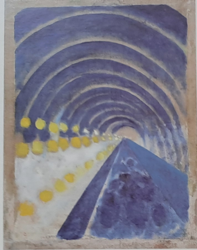
Metro, 1998, olej, plátno, 80 x 60 cm

Ne, nelákalo... jednak je jich všude kolem takové množství, že se v nich ztrácím a na druhé straně