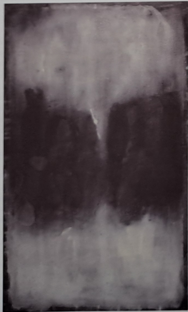
Zčernalá kra, 2008, akryl, plátno, 148 x 91 cm

věci, které v zápětí můžeš mechanicky zopakovat, ale důležité je překračování těchto hranic stále dál. Spokojení se s vlastní malbou a nechat ji být, ať se nepokazí, je to nejhorší, co se může malíři stát, je to cesta do pekel. Ze střední školy si pamatují tuto tragickou větu, kdy mi profesor písma říkal, mistře, nechte to být, ať to nepokazíte. Pocit štěstí se dostavuje, nejčastěji v procesu malby samotné, než z výsledku. Malba je určitý spirituální tanec nad plátnem, poslední dobou malují více méně s lehkostí, dokonce mám rád, když se téměř nemusím příliš moc obrazu ani dotýkat, kdy vznikne jen tak sám od sebe. Kdy není unavený ani obraz, ani já. Často v průběhu malby pracuji s podvědomím a se snem samotným. Během práce někdy usnu, pak se probudím, a obraz většinou domaluji.