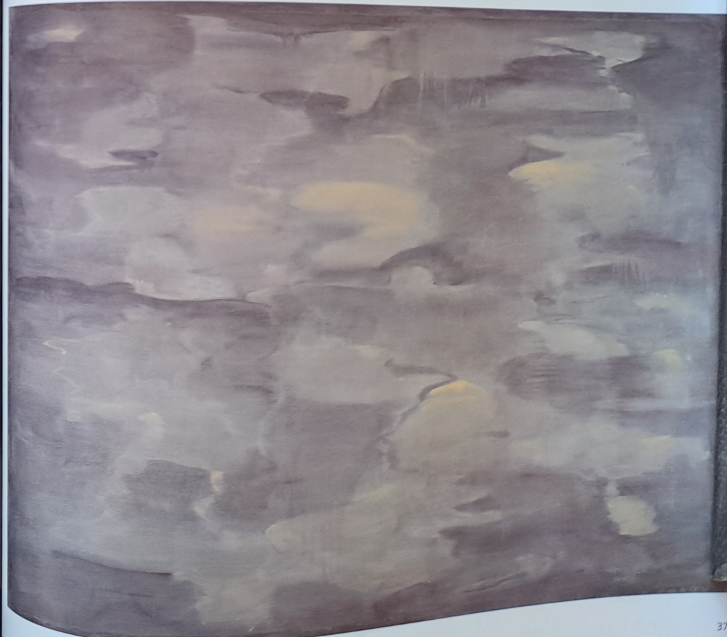
Apokalyptická krajina I, 2008, akryl, plátno, 150 x 200 cm

Po Rusku, asi mém nejsilnějším malířském období, kde jsem udělal kvanta obrazů, přivezl, přepnul je a dál z nich čerpal. U Kokolii jsem namaloval snad 2 až 3 obrazy. Problém samozřejmě nebyl v Kokolioví, ale ve mně, příliš jsem asi lpěl na tom, abych při malbě byl zcela sám a nebyl jsem ochoten akceptovat něčí přítomnost, popřípadě odbíhat k zajímavým diskusím. Pak jsem se najednou zablokoval, naprosto iracionálně se nechal odvábit větším prostorem pro malbu, hlasem rozumu a nasloucháním jiného mistra Nešlehy. Kokolii šel v malbě pod povrch a to bylo pro mne naprosto stěžejní a zásadní.