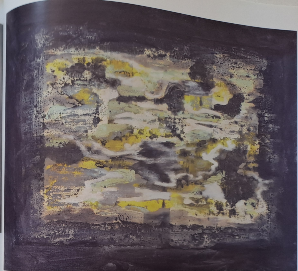
Apokalyptická krajina, 2008, akryl, plátno, 80 x 100 cm

Jak pracuje se symbolikou? Poutník, krajina, pak krystaly, lodě, kruhy, rastry... Jak to šlo po sobě? Interpretace zvolených symbolů či jakýchsi fragmentů reality je zcela volná nebo má jistou vnitřní logiku (opodstatnění, asociace apod.)? Proč například zasazuješ do kompozic kánoe?