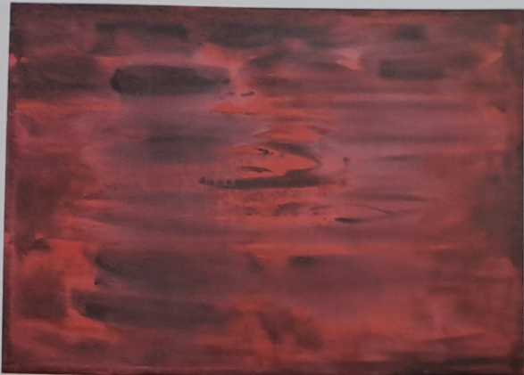
Rudá krajina, 2008, akryl, plátno, 105 x 142 cm