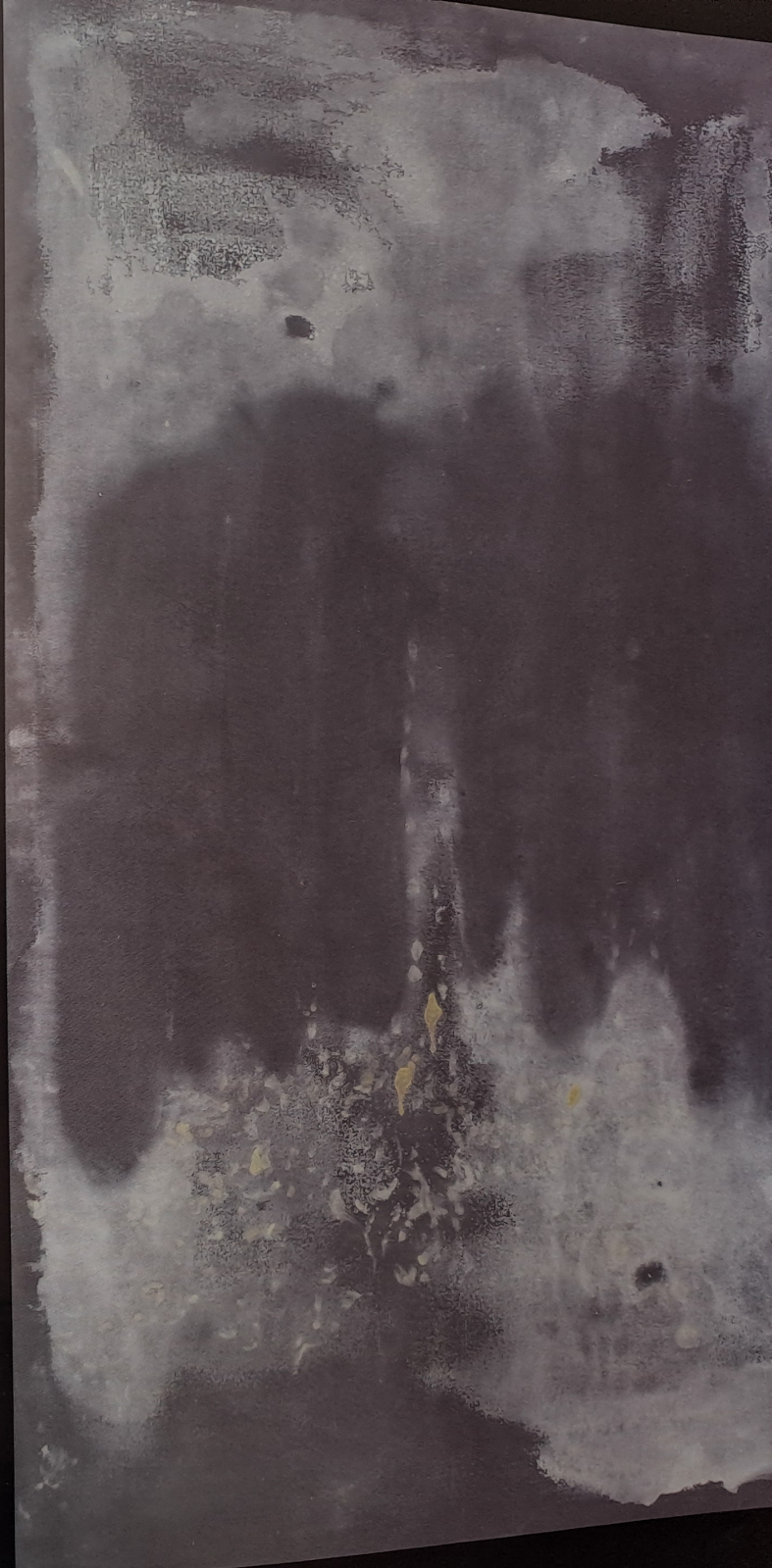
Sakrální nečistoty, 2008, akryl, plátno, 148 x 91 cm

Jaký ještě převažoval při malbě těchto kompozic pocit? Zakoušel jsi nostalgii, nihilismus, bezvýchodnost a nebo spíše přeci jen naději,